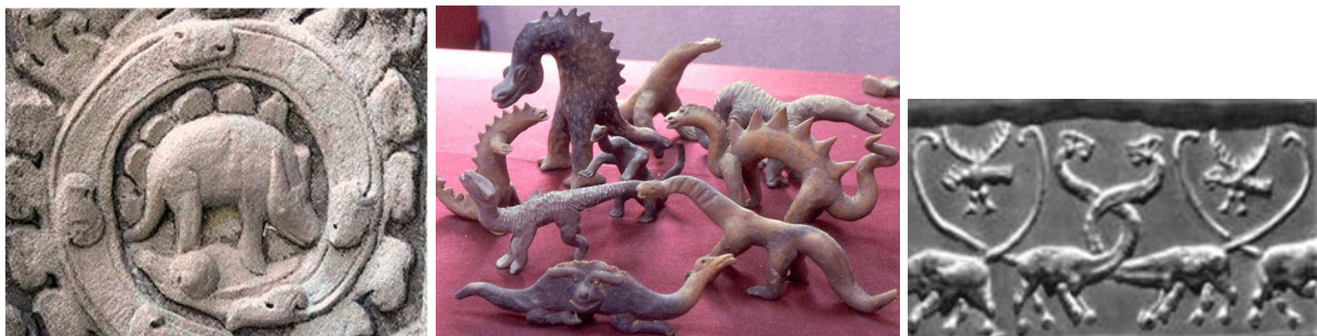
(세계 곳곳에 발견되는 공룡 작품들 그림들)