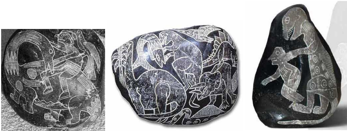
( Ica Stones )

성경에는 심지어 leviathan, behemoth (욥기 40:15-24, 욥기 41) 라는 공룡 이야기도 하고 있으며, 마얀 지대나 남아메리카 그리고 세계에서 발견되는 공룡이 사람과 함께 존재하는 것을 그린 유물들, 그림들, 요즘에 공룡화석에 공룡의 살과 피가 발견되어 공룡이 죽은 지 몇 천 년 밖에 안 될수없다는 보고들로 보아 공룡이 사람들과 함께 존재했다는 것을 확인할 수 있습니다.